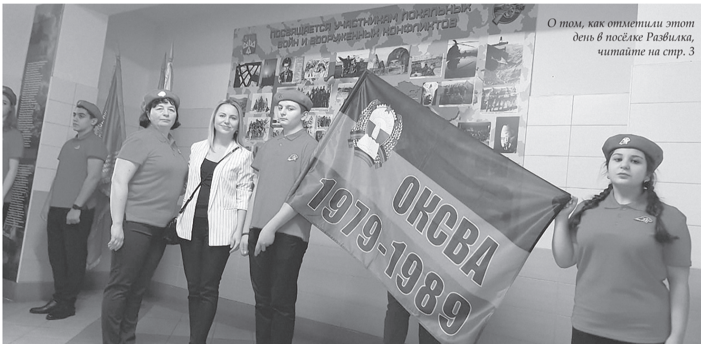
О том, как отметили этот день в посёлке Развилка, читайте на стр. 3

под Сталинградом, и День памяти россиян, исполнявших долг за пределами Родины, и, конечно же, День защитника Отечества.