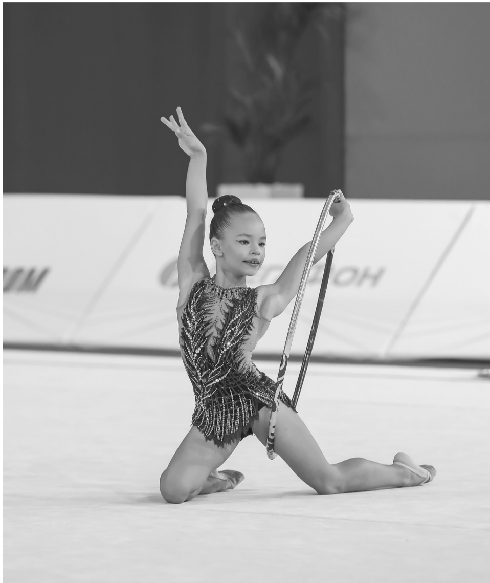
Художественная гимнастика – один из самых красивых видов спорта

Сегодня, в свои десять лет, девочка выступает в группе А – это означает, что она профессиональная спортсменка. Ей присвоен третий взрослый разряд, осенью планирует получить второй. А еще она учится в обычной школе, точнее, в