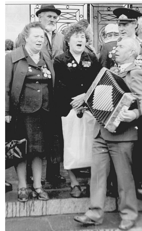
Ветераны города Видное празднуют День Победы