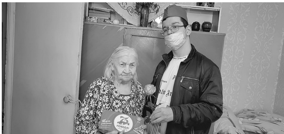
Накануне праздника волонтеры доставили пожилым людям подарки

Звонки с просьбами от жителей поступают в объединенный колл-центр, который размещен в здании МФЦ города Видное. Операторы внимательно выслушивают, записывают заявки, когда необходимо – разъясняют и дают нужную информацию. А дальше наступает работа волонтеров, ежедневно, с раннего утра и до поздней ночи, без выходных. Кто эти люди? Все, кто живет рядом с нами – работники культуры и спорта, инженеры